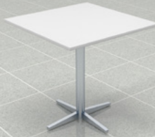
Besprechungstisch, 70 cm x 70 cm