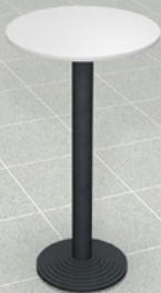
Stehtisch, 60 cm x 115 cm