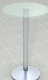
Glas-Stehtisch, 70 cm x 115 cm