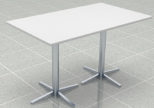
Besprechungstisch, 70 cm x 120 cm